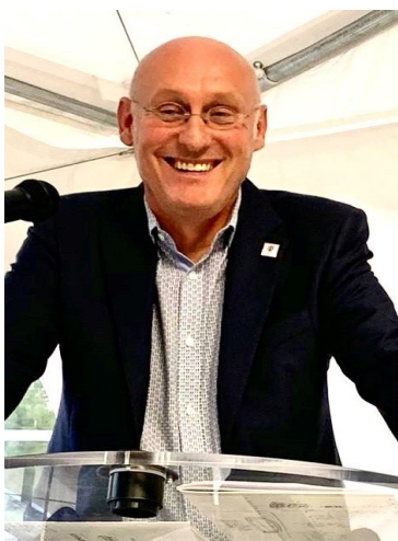
Bernard LAPORTE, Pdt FFR

Nous les remercions de nous avoir répondu dans le délai que nous avons défini et vous trouverez dans les pages qui suivent la fidèle reproduction de leur courrier respectif. Le contenu vous éclairera sur les visions de chacun au sujet de la pratique spécifique de notre rugby loisir avec placage adapté.